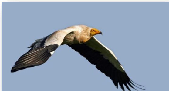
کرکس کوچک ۳

حالت گل در بیاید سپس به‌عنوان خوش‌بوکننده به بدن خود می‌مالیدند. در آن زمان کرکس‌ها که احتمالاً برای رنگ‌دادن به پرهای سفید خود این گل‌ها را برمی‌داشتند، میان افراد بومی قشم به «بودزد» که منظور دزد بو است، معروف می‌شوند. «دال‌من» نام دیگری از کرکس کوچک است که افراد محلی قشم آن را با این نام می‌شناسند. این نام که به زبان پهلوی است همچنان از روزگاران قدیم در قشم بازمانده است.