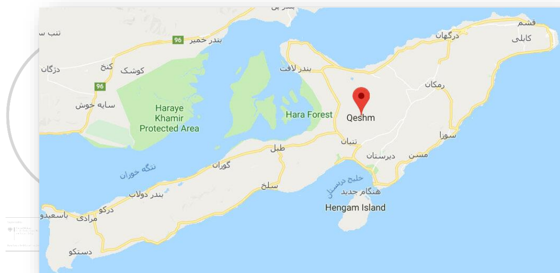
جزیره قشم ۴

از طرفی پرندگانی را می‌توان در این جزیره دید که در نقاط دیگر به‌سختی قابل مشاهده هستند. مانند: چاخلق هندی؛ چراکه نسبت جمعیت پرندگان به مساحت جزیره بسیار زیاد است.