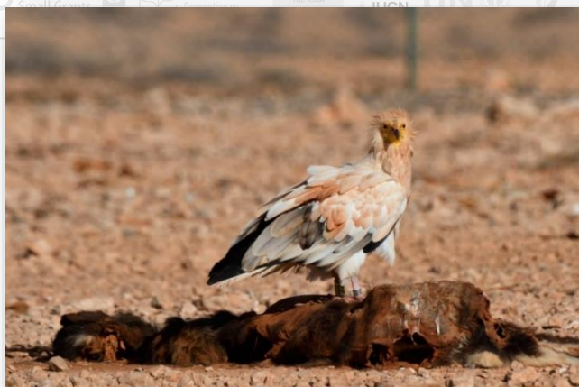
اگر قصد طعمه‌گذاری برای عکاسی دارید، حتماً با کارشناسان مشورت کنید. ۶

کرکس‌ها عمدتاً در اماکن انباشت زباله پیدا می‌شوند. بیشترین کرکس‌های کوچک در جزیره قشم در این مکان‌ها دیده می‌شوند. حواستان باشد این مکان‌ها به شدت آلوده هستند و ممکن است بیمار شوید. بهتر است برای پرندنگری یا عکاسی از کرکس‌ها از فاصله دور اقدام کنید. یا از افراد بومی برای پیدا کردن مکان‌های مناسب‌تر کمک بگیرید.