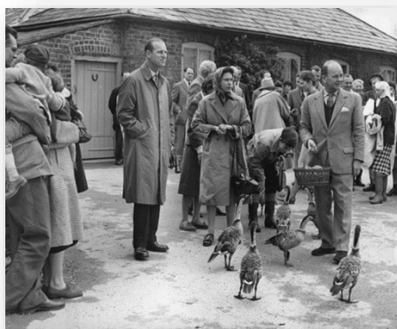
پرنده‌نگری خانواده سلطنتی انگلستان ۲

در دوران ملکه ویکتوریا، پرنده‌نگری با هدف جمع‌آوری تخم و پوست گونه‌های زیبا و رنگارنگ پرندگان انجام می‌شد. در آن زمان، کلکسیونرهای ثروتمند با استفاده از ارتباطات‌شان در مستعمرات بریتانیا به گونه‌های کمیاب سراسر جهان دست می‌یافتند. در قرن نوزدهم میلادی بود که اولین درخواست‌های محافظت از گونه‌های در معرض خطر صورت گرفت و اولین انجمن Audubon در آمریکا بنیاد نهاده شد. انجمن‌های آودوبن و انجمن سلطنتی محافظت از پرندگان بریتانیا (RSPB)، که برای مقابله با تجارت پرندگان طراحی شده بودند، راه را برای پرنده‌نگری به‌عنوان یک فعالیت تفریحی و نیز محافظت از گونه‌های بی‌شمار پرندگان هموار ساختند. ۱