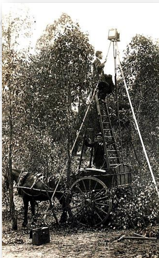
عکاسان پرنده نگر، نیو ساوت ولز، ژوئن ۱۹۲۱ ۴

supported by International Development Research Centre International Development Research Centre International Development Research Centre gef SGP The Small Pro